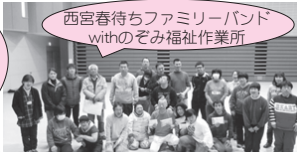
西宮春待ちファミリーバンド with のぞみ福祉作業所

甲府東高校「震災から学ぶ」研修 in アリーナグループワークでは体験談を語り聞かせる