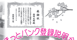
ほっとバンク登録説明会