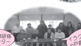
イラク政府視察 in 戸倉地区仮設