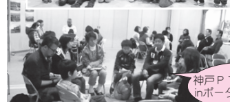
神戸PTA視察研修 in ポータルセンター